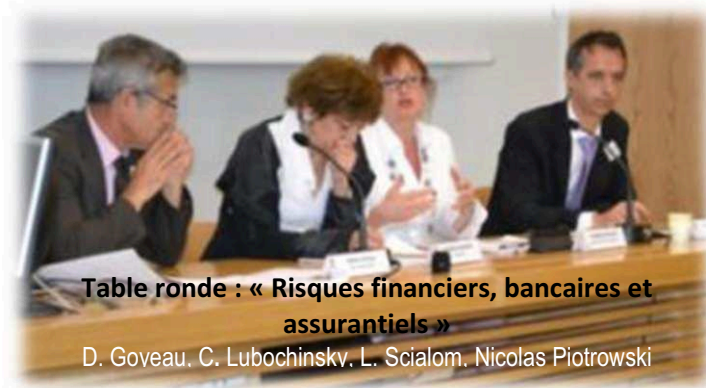
Table ronde : « Risques financiers, bancaires et assurantiels »