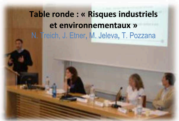
Table ronde : « Risques industriels et environnementaux »