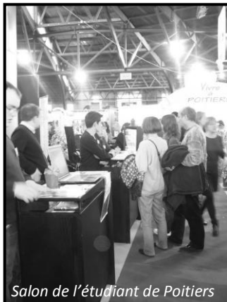
Salon de l'étudiant de Poitiers